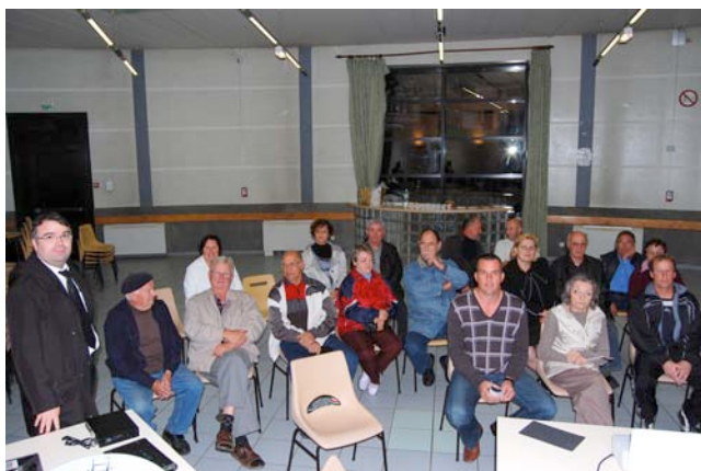
Présentation de la TNT.