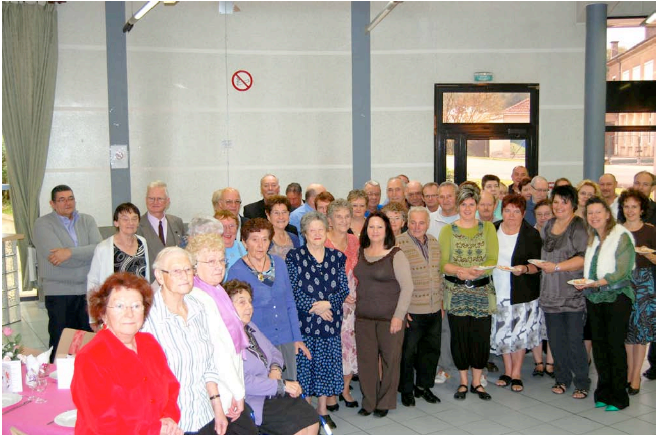
Le 17 Octobre, le Conseil a reçu les Anciens pour son traditionnel repas.