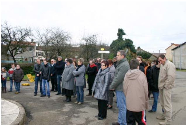
Le dépôt d'une gerbe de fleurs au monument aux morts.