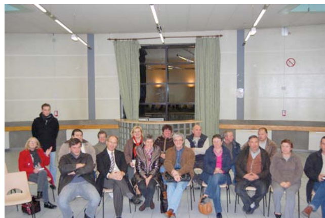
Présentation du Wifimax : réseau Internet mis en place par le Conseil Général