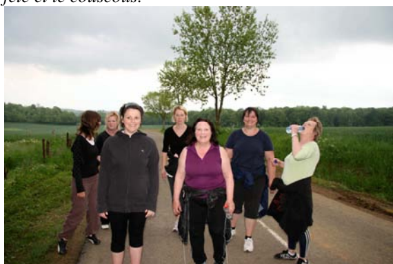
Promenade des membres du club d'aérobic en juin.

A noter qu'un club de marcheurs, dépendant du club de l'amitié vient d'être créé.