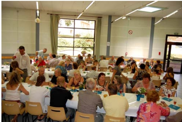
Le dépôt d'une gerbe de fleurs au monument aux morts.