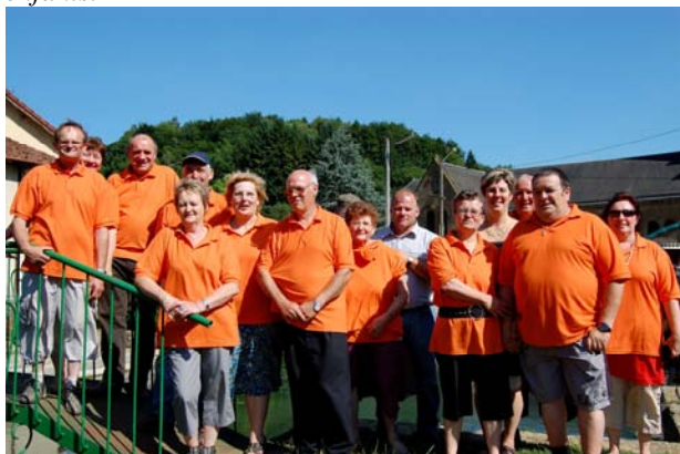
L'équipe orange du comité des fêtes prête pour la fête et le couscous!