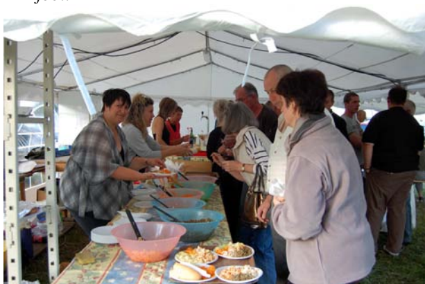
Le feu d'artifice des Franco-Belges était très réussi