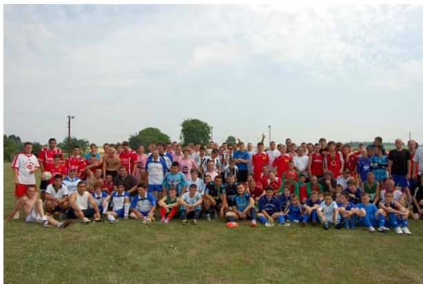
Le FCAL a organisé son traditionnel tournoi de foot.