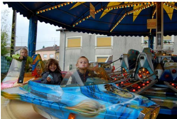
Comme chaque année, les forains font la joie des enfants.