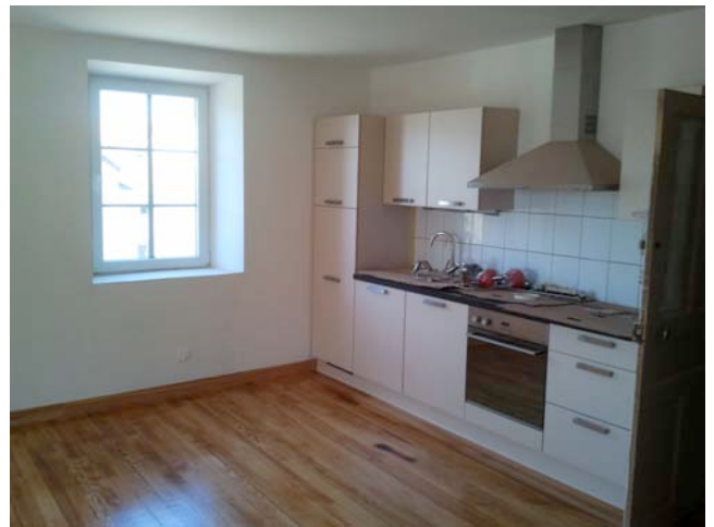
Cuisine intégrée du 1 er appartement.

Un second appartement est en cours de création.