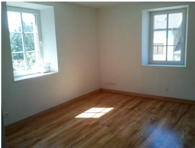
Partie « séjour » du 1 er appartement.

A noter que le premier appartement comporte une cuisine, un séjour, deux chambres et une salle de bains. La cuisine est équipée comme en témoigne la photo ci-dessous.